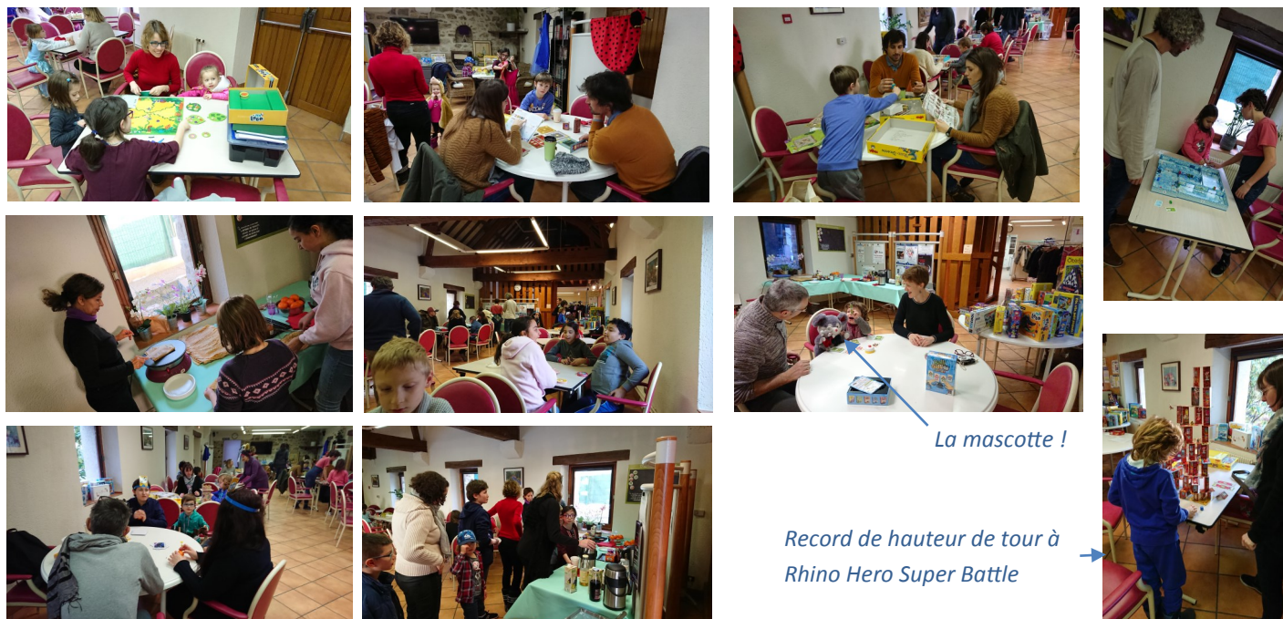
La mascotte !

Vous étiez près de 65 personnes présentes pour déguster les crêpes autour d'un délicieux chocolat chaud, diverses boissons chaudes ou froides et fruits à la Bergerie (Espace seniors)! Ce fut un joli moment de partage entre amis et en famille. Les plus petits ont investi l'espace « déguisement et coloriages ». Les plus grands se sont retrouvés pour des parties jouées avec, entre autres, Rhino hero super battle , le jeu du loup ou Ice cool . Merci à l'invité spécial et VIP, la mascotte de la petite section de maternelle de l'école Médicis, de sa présence !